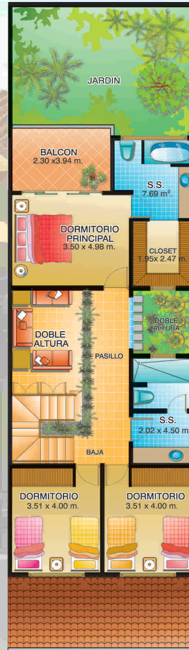
Planta Alta - Opción 1