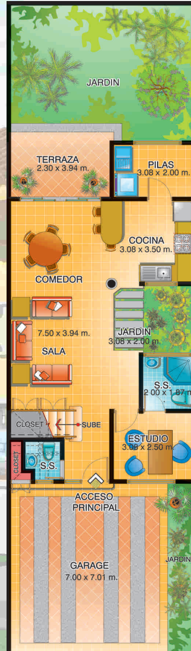
Planta Baja - Opción 1