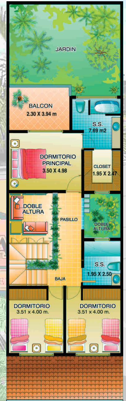
Planta Alta - Opción 2