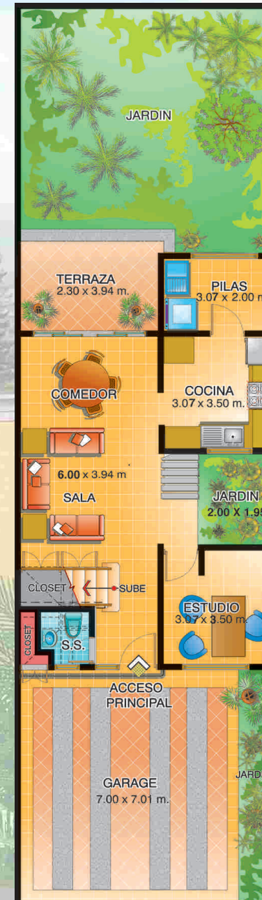
Planta Baja - Opción 2